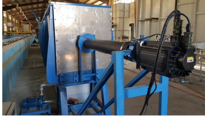
Actuator & Paddle